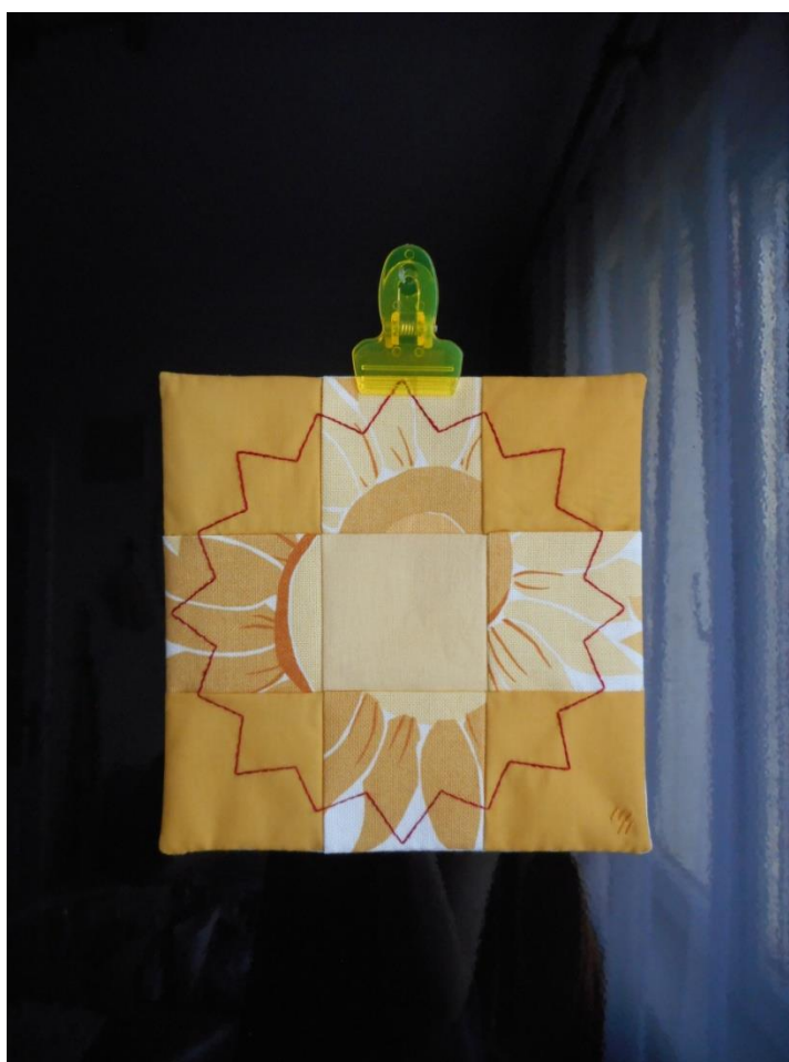
Лоскутная композиция «Солнце»

Я даю лоскутам ткани складываться в образы и оформляю арт-объект. Зелёные могут быть травой, голубые – небом, розовые – человеческой кожей, в цветок – фарфором, в клетку – решёткой, в горох – падающим снегом, и так далее. Минимум изображения, максимум видения!