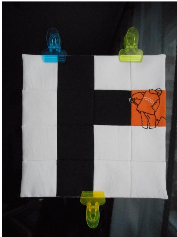
Лоскутная композиция «Дворник (чистит дорожку от снега)»

Пусть зритель, поклонник, заказчик придёт сам, задерживается по своей воле. Художник – не маркетолог. К нему обращаются за причастностью к творчеству/ за сотворчеством.