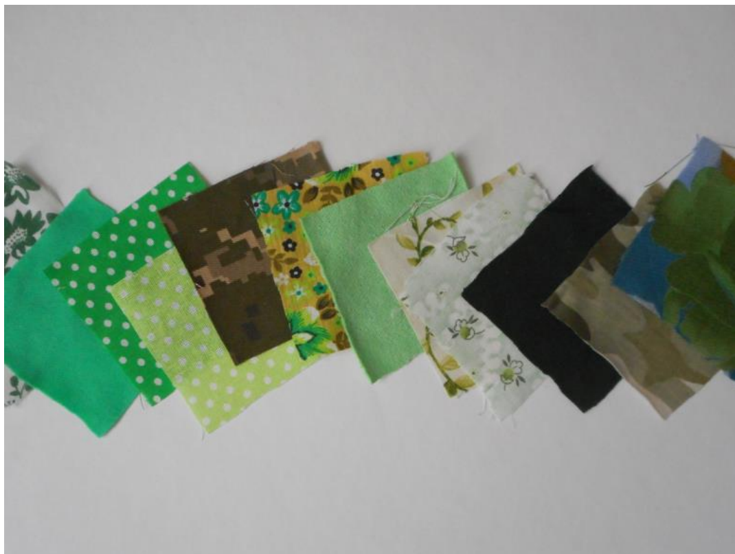
Моя палитра: зелёный

Я принципиально работаю с одеждой/текстилем б/у.