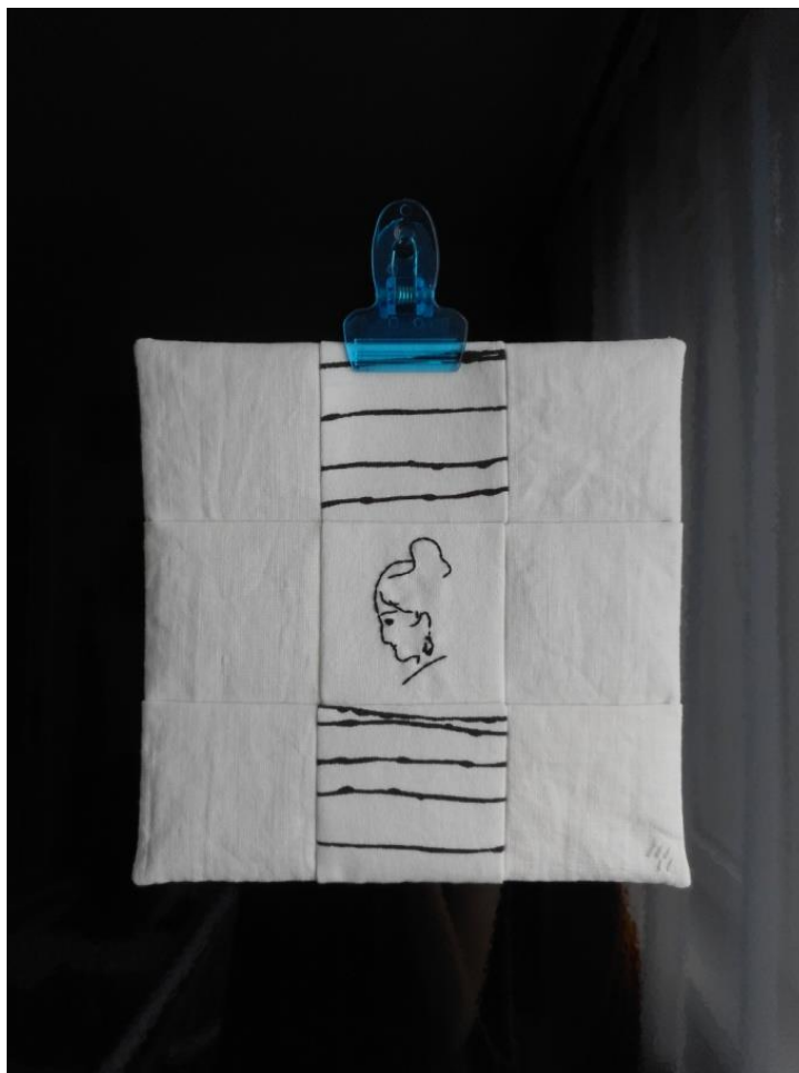
Лоскутная композиция «Поэзия»

Планируя произведение, я ориентируюсь на тепло отклика.