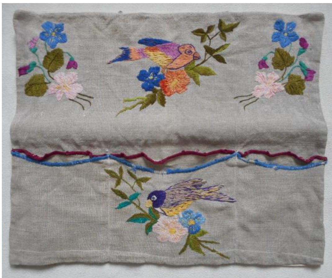
Организер работы моей прабабушки

Совмещая лоскутное шитьё и вышивку, я продолжаю историю женского (в том числе в моём роду) рукоделия, которое переосмысливаю в духе времени.