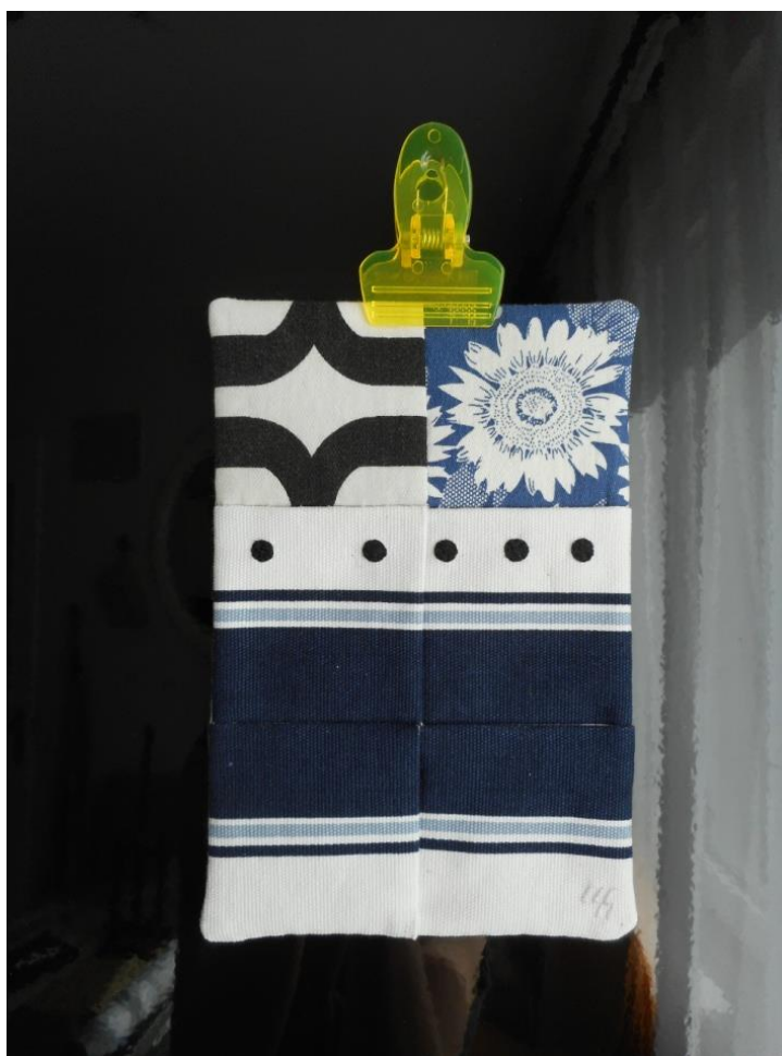
Лоскутная композиция «Газ (горит синим цветком)»

Не вовлекать в терапию пришедших за искусством – элемент гигиены труда художника для меня.