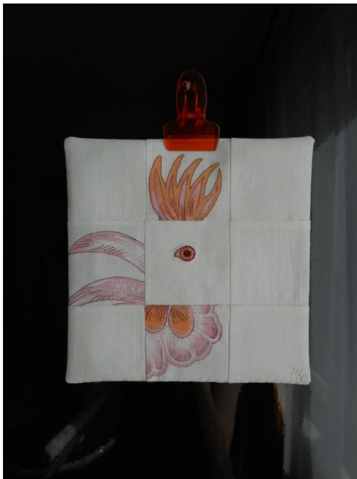
Лоскутная композиция «Петух»

Искусство – возврат в невинность, открытость, радость. Внутренний ребёнок – мой авторский камертон.