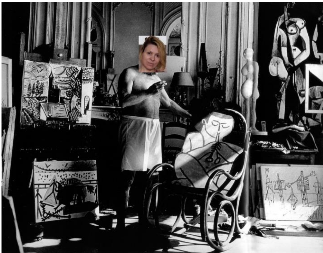
Моя ролевая модель – Пабло Пикассо

В какой-то момент своей жизни я признала: несмотря на диплом иняза, у меня тот самый художественный взгляд. Я больше не могу не заниматься искусством. Буду учиться в процессе!